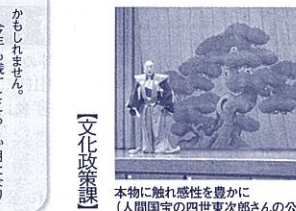
文化政策課 本物に触れ感性を豊かに(人間国宝の四世東次郎さんの公演)

1日が25時間いや26・27時間あればと思うところがあり、色々やっていた。この時、時間がなくてと言いつつ、1日が24時間、1年が365日だっつて、その限られた中でどうやっていく工夫したり考えたりと面白いは、工夫したり、時間が経てばその分短くなる。