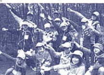
小学生や家族向けのイベント盛りだくさんの観音山少年の家。今回は、早春の観音山で思いっきり活動しませんか。「森のワクワク探検」や「夜のドキドキ探検」などの楽しい体験が待っています。観音レンジャーも小さな探検家のみなさんを待っていますよ。

日時 第1回 平成25年3月2日(土)～3日(日)【1泊2日】 第2回 平成25年3月9日(土)～10日(日)【1泊2日】 対象 小学校1～3年生 参加費 5,000円 定員 各回108人(応募者多数の場合は抽選) 受付 平成25年1月6日(日)～2月4日(月)(消印有効) 郵送にて受付(第1回、2回の両方への申込み不可)