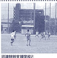
沼津特別支援学校と沼津城北高等学校の交流