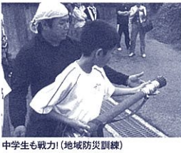
中学生も戦力!(地域防災訓練)

多くの人とのふれあいを この地域の生徒のほとんどは、中学校卒業までを限られた人間関係の中で過ごします。そのため仲間意識が強く、学年の隔たりを感じさせないよう人間関係が築かれています。一方、人間関係の