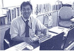
手に持つタブレット端末はもはや必需品。PC2台とともに今日もフル稼働。

年金関連情報は、「福利しずおか」や福利課ホームページ等でお知らせしていきますが、制度の詳細は、地方公務員共済組合連合会ホームページを御覧ください。 [HP] http://www.chikyoren.or.jp/nenkin/tigenkahtml [福利課年金・貸付担当] 054(221)3132