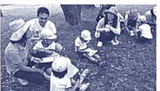
幼稚園親子遠足のネイチャーゲーム

小学校で環境教室の外部講師を務めています。子どもたちは、「絶滅危惧種」は知っていても、校庭にやってくる野鳥に目を留めないことがあります。みんなかじっとして耳をすましている。と・ほら、小さいキツキツのコケラもいるよ。そんな瞬間に出会うと、子どもたちの気持ちは大きく動きます。「なんだ、私たちの周りによく見たら、たくさん発見があるんだ」と。自分をとりまく環境への興味や愛着が生まれます。環境への行動につながるのです。子どもたちに環境問題を伝え、よりよい行動ができ、問題解決能力を身に付けさせるための「仕掛け」や「スキル」を提供します。お気軽に御相談ください。