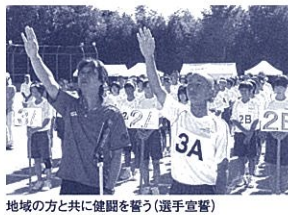
地域の方と共に健闘を誓う(選手宣誓)

本校の体育祭は、地域と合同で行っています。計画の段階から地域の方と話し合いを重ね、会場準備、運営、片付けまで地域の方と生徒が共に行っています。