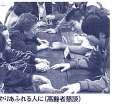
思いやりあふれる人に(高齢者懇話)

のテントでは、地域の方と生徒が一緒になって競技の応援をします。「速かったね」「最後までよく頑張ったね」と地域の方から声を掛けられ、生徒は満足そうに笑顔を浮かべます。