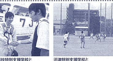
藤枝特別支援学校と焼津水産高等学校の交流

県教育委員会は、「共生・共育」を推進するため、平成11年度から、小・高校の教室を活用した特別支援学校分校の設置を進めてきました。開始以来10年以上が経過し、その効果も大きく評価されています。「共生・共育」を実施している学校からは、子どもた