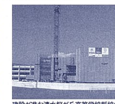
建設が進む清水桜が丘高等学校新校舎

普通科、商業科を併置する清水桜が丘高等学校は、エアコンを完備した新校舎の中に、充実したICT環境を備える計画です。