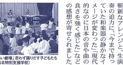
「ふれあい劇場」思わず踊りだす子どもたち(県立浜北特別支援学校)

◆音楽公演「はじける日本の音色」 出演は、第3味線 邦楽パーカッションの3人の奏者によるユニット「INSPIRATION」です。民謡や伝統曲、歌舞伎など伝統芸能の音曲を元にしたオリジナルもあり、斬新なアレンジと、生演奏の迫力に、「今まで持っていた和楽器の静かなイメージが変わった」「現代的なのに日本の音や曲の良さを強く感じた」などの感想が寄せられました。