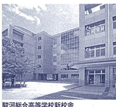
駿河総合高等学校新校舎

新校舎には、教室と生徒ホール・階段式視聴覚教室・陶芸室などが「光庭」を囲んで配置されています。また、CAD室、CG室などの情報関連教室が7室と充実しています。