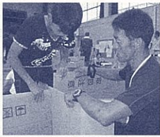
避難所生活体験(居住区づくり)

10月11日には、第2回学力向上推進協議会を開催しました。県教委、推進地区市教委、推進校の取組状況の確認と、今後の具体的な取組について協議しました。