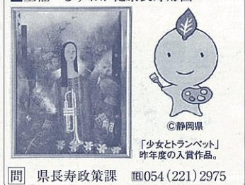
「少女とトランペット」昨年度の入賞作品。 県長寿政策課 電話054(221)2975

~静岡県の高い芸術レベルを感じてください~ 60歳以上の方たちの豊富な人生経験から生み出される美術作品の展示を行います。 長い間培ってきた技を發揮したすばらしい芸術作品が勢揃いしており、若い学生の皆さんにもきっと感じるものがあると思います。入場無料、どなたでも観覧できますので、ぜひ気軽に足を運んでください。 ■日時 1月17日(金)~26日(日) ※20日、22日は休館日及び作品入れ替えのため観覧できません。 ■展示内容 日本画、洋画、彫刻、工芸、書、写真 ■場所 県立美術館県民ギャラリー ■主催 しずおか健康長寿財団