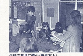
生徒の意見に感心(筆者左上)