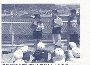
避難訓練の振り返りも子どもたち自身で

大きな地震が起きた時に、子どもたちの回りに教師や大人がいるとは限りません。そのため「子どもだけでも正しい判断ができるように」「子どもたちと考える避難訓練」を計画し、実施することにしました。そして、各