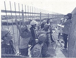
建物の屋上で避難の仕方を確認