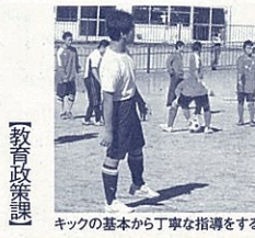
キックの基本から丁寧な指導をする御南部員

「有徳の人」に会いに行こう 其の七 交流で互いを高め合う「有徳のサッカー部員」に出会いました! 「有徳の人」を育む活動を紹介しているこのコーナー。今回は、もくせい杯(県内特別支援学校のサッカー大会)での勝利をねらう御殿場特別支援学校(御特サッカー部)と強力にバックアップする御殿場南高校(御南)の共同プロジェクトを紹介しよう。