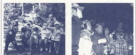
観音レンジャーも皆さんを待っています。子どもたちの目が輝く夜のドキドキ探検。

小学生向けや家族向けのイベントが盛りだくさんの観音山少年自然の家。今回は、早春の観音山で思いっきり活動してみませんか。「森のワクワク探検」や「夜のドキドキ探検」「沢のウキウキ探検」などの楽しい体験が小さな探検家の皆さんを待っています。