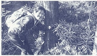
この樹木も文化財(ホソバシャクナゲ)

天然記念物ホソバシャクナゲの現地検討会(浜松市天竜区龍山町)では、登山者さながらのいでたちで道なき斜面を登り、現地の状況を確認。関係者と今後の保存方法を検討しました。仕事で人里離れた山中の尾根でお弁当を食べることになるとは…。夢にも思いませんでした。