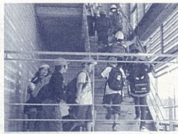
津波が起きたときの避難場所を確認

今、静岡県では、南海トラフ大地震が懸念されています。そんな「いざという時」に、本校の子どもたちには、本校の子どもたちが本来持つ「思いやり」や「優しさ」を発揮してほしいと願っています。そして、そんな思いやりを基盤にした「正しい判断」を「自分でできる」子どもであってほしいと思います。