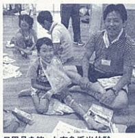
日用品を使った応急手当体験

子どもたちの自主性が表れてきた。(学校) ◆他の地域でも防災キャンプを実施し、防災力の向上につなげたい。(行政)