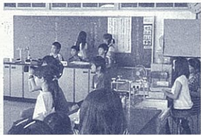
代表委員会が中心となって避難訓練の想定や役割を考える