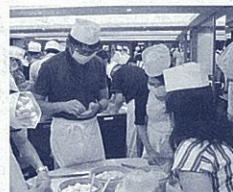
本場で小籠包作りを体験

富士山静岡空港利用促進協議会では、修学旅行で静岡空港の利用を促進するため、毎年年度教育旅行調査団を就航地へ派遣しています。今年度は、高校教育課長を団長に、校長・副校長・教頭などの管理職に参加いただき、8月8日から12日までの5日間の日程で、台湾を訪問しました。