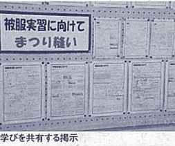
学びを共有する掲示