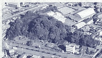
前方部側から見た神明山1号墳