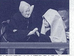
「人形浄瑠璃 文楽」