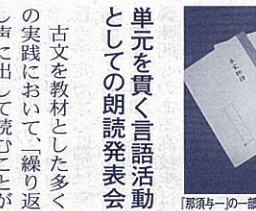
「那須与一」の一部を口読し、子どもが「理解」や「すいた」の様子

「Aは、「あやまたず扇のかなめぎは一すばかりおいて、ひいふつとぞ射きつたる。かぶらは海に入りければ、扇は空へぞあがりももたれ、海へさつとぞ散つたりける。」との「射きつたる」の後に「さつとぞ散つたりける」の間に置いて、その後少し間を置いて、その後「さつとぞ散つたりける」と発言しました。