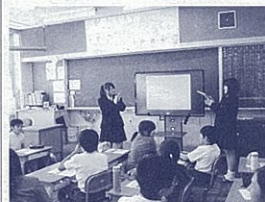
高校生が小学生に食の重要性を伝える

東伊豆町立稲取中学校、県立稲取高校は、今年度、文部科学省の指定を受け、「スーパー食育スクール(SSS)」の実践校として、食育に取り組んでいます。取組テーマは、「食と健康についての意識を高め、実践力を身に付ける」～幼小中高地域が一体となった食育の推進を目指して～です。