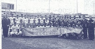
台湾チームからは熱い歓迎を受けました。(全員での記念撮影)

この交流に参加した高校生たちは、海外の同世代の若者と交流したことで、国際的な視野や価値観の獲得につながったことでしょうか。是非、学校や地域などにおいて、この体験を多くの方に伝え、友好親善関係の一層の進展につながることを期待しています。