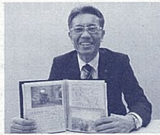
「宝物」のアルバムと筆者