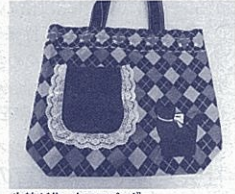
生徒が作ったエコバッグ

「振り返り」習得した技術を生かし、自分で考えたデザインをもとにアレンジを施しました。自分らしさや機能を考え、ポケットやボタン、裏地を付けたリ、刺しゅうによってデザインを工夫したりし、世界に一つの個性