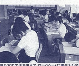
読み方の工夫を考えて、ワークシートに書き込む子どもたち