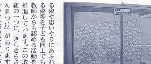
「きらきらさん」が「いっばい」の「かがやきの木」

平成27年度の募集は、3月下旬から4月中旬に行う予定です。詳細は、実施内容等が分かります。