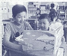
ペア活動を通して「思いやり」を学ぶ