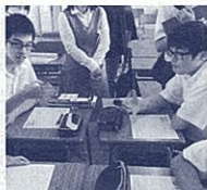
技能を統合した英語によるコミュニケーション活動の場面

高校生が友人の意見を英語で聞き、それについて英語で質問をするなどの活動を通して英語の4技能(聞くこと、話すこと、読むこと、書くこと)をバランスよく育成する授業が多くの学校で展開されています。