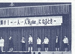
潮風祭での生徒会本部による劇の様子

を果たしています。学校・家庭・地域が一体となって地域ぐるみで子どもを育てています。活動がさらに県内各地で広がっていくことを期待しています。【社会教育課】