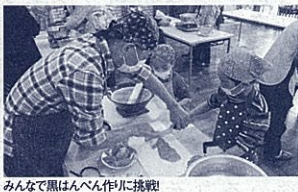
みんなで黒はんぺん作り挑戦

問・申 焼津青少年の家 TEL054(624)4675 HP: http://yaisei.jp/