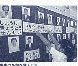
みんなでクイズ大会(筆者・右上)

「安心してできる場所」 「すいかを育てよう」 6年生のEさん「先生、すいかの芽が出ましたよ!」 給食で食べたすいかの種類をプランターにまいていたEさんが、話しかけてきました。「え、雑草でしょ」とたかをくくっていたら、本葉が出て、ツルが伸びてきました。畑に植え替え、成長を願いつつ、仲間と一緒に安心できる場所になったんだと、胸が一杯になりました。