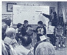
みんなでクイズ大会(筆者・右上)

「安心してできる場所」 「すいかを育てよう」 6年生のEさん「先生、すいかの芽が出ましたよ!」 給食で食べたすいかの種類をプランターにまいていたEさんが、話しかけてきました。「え、雑草でしょ」とたかをくくっていたら、本葉が出て、ツルが伸びてきました。畑に植え替え、成長を願いつつ、仲間と一緒に安心できる場所になったんだと、胸が一杯になりました。