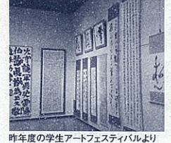
昨年度の学生アートフェスティバルより