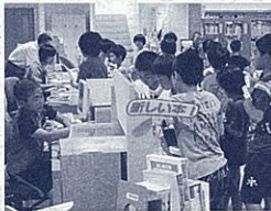
昼休みに本を借りる子どもたち

今年8月に島田市立川根図書館が川根小学校の学校図書館と併設でオープンしました。市立図書館と学校図書館の間に仕切りがなく、自由に行き来できる全国でも珍しい図書館です。