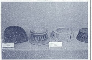
出土した硯(井通遺跡)

井通遺跡で出土した硯の一部は、県埋蔵文化財センター常設展示「古代からの贈り物」(県立中央図書館3階展示室で開催中)でご覧いただけます。