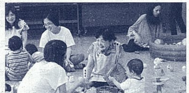
島田市子育て広場の様子

講座に参加した保護者からは、「子育ての参考に became a 悩みや不安を話す機会が得られて良かった」などの感想が多数寄せられました。また、講座のよさを感じた保護者が、保護者会で自主的に話し合いを行うなど、保護者の中に支援の効果が広がっています。