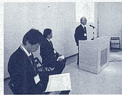
平成27年度表彰の様子(東部)