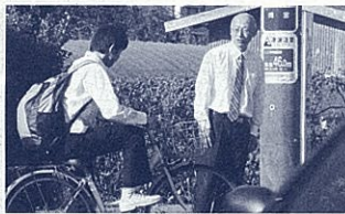
筆者(登校指導にて)

休館中の資料返却は、当館ブックポスト、グラフィック他、お近くの市町立図書館のカウンター等へお願いします。 なお、お申し込みは1月30日(土)、31日(日)を除き開室します。