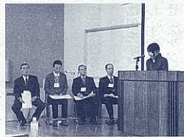
平成27年度表彰の様子(中・西部)