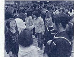
わたしをよろしく(交流活動より)

「安心してできる場所」 「すいかを育てよう」 6年生のEさん「先生、すいかの芽が出ましたよ!」 給食で食べたすいかの種類をプランターにまいていたEさんが、話しかけてきました。「え、雑草でしょ」とたかをくくっていたら、本葉が出て、ツルが伸びてきました。畑に植え替え、成長を願いつつ、仲間と一緒に安心できる場所になったんだと、胸が一杯になりました。