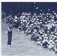
交流活動の進行を行う筆者

はままつの教育のキーワードである「心の耕し」について、前任校の浜松市立丸塚中学校では、学区の小学校とともに「ハートセッション」と名付けた交流活動を行ってき