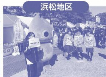
H30.2.18 浜松シティマラソンでPR