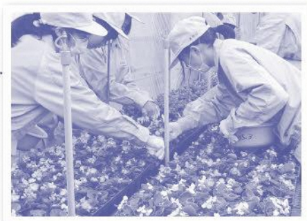
花を育てる静岡農業高校生徒

農業高校を中心に大会会場を彩る花を栽培しています。大会期間中は花で彩られた会場が全国の選手を迎え入れます。