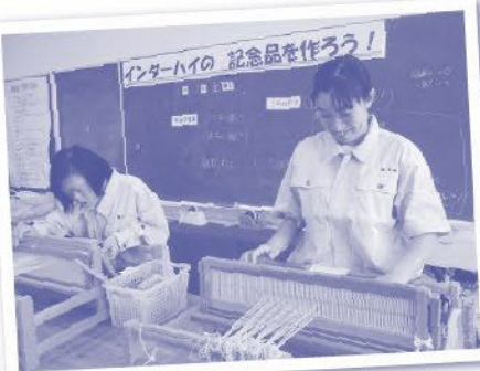
袋井特別支援学校の生徒が記念品製作中

袋井市に伝わる伝統文化である丸風を、袋井市周辺の学校12校の約100人の生徒が協力し、製作しています。丸風は弓道競技が開催されるエコパアリーナに、団体戦に出場する96校の学校名を毛筆で書き展示します。