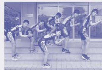
TWICEでお馴染みのTTポーズ 自転車競技部はTime Trialの姿勢がTTポーズだそうです