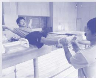
足ツボマッサージ?いいえ準備運動です

※マネージャーから転身した選手や、トランポリン競技も行っている二刀流選手など今後も注目したい。