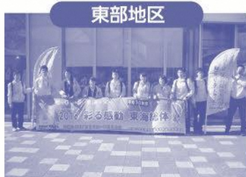
H29.11.11 よさこい東海道でPR