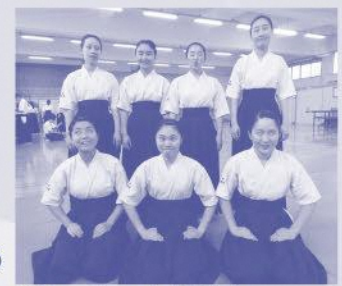
団体メンバーの7人(変顔編)