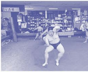
相手がなくても手の返しを意識する

ありますね。子どもの試合の手伝いに行ったり、合同稽古をやったりすることは結構多いですね。