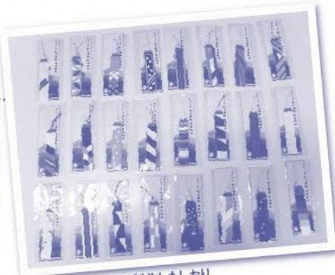
選手の健闘を願って製作したしおり

選手・監督に記念品として配布する「しおり」を手作りました。県内の高校20校の生徒が協力し、約6,000個のしおりを製作しました。