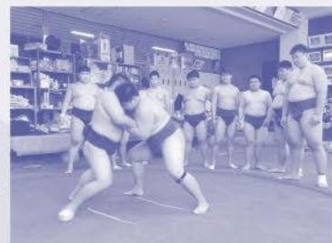
激しいぶつかり合い、勝負は一瞬