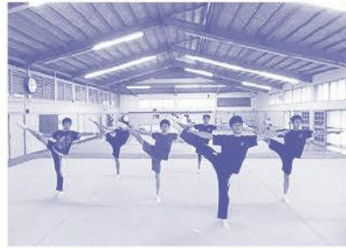
この統一感が重要