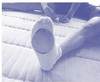
約3カ月間、使用した靴下

技の研究をしたりして、新体操を本当に好きになってくれたと感じる瞬間は、本当に良かったなと思っていますね。