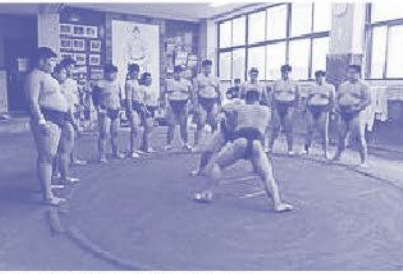
迫力が..直接見るとビックリします