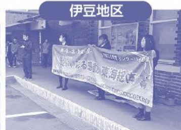
H30.1.21 伊豆市駅伝大会でPR