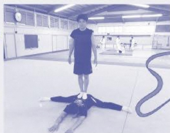
究極のストレッチ…。体が硬い人はマネしてはいけません