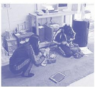
裁縫をするマネジャー

演技の曲の準備や、ドリンクの準備、ユニフォームの飾り付けなどの裁縫をしてもらっています。