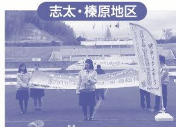
H30.3.10 サッカーJ3リーグでPR