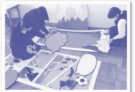
歓迎ボード製作中

全国から訪れる選手を歓迎するボードを、藤枝西高校の生徒が製作しています。歓迎ボードは女子サッカーが開催される藤枝総合運動公園サッカー場に設置します。