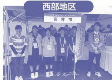
H29.10.14 ラグビートップリーグでPR