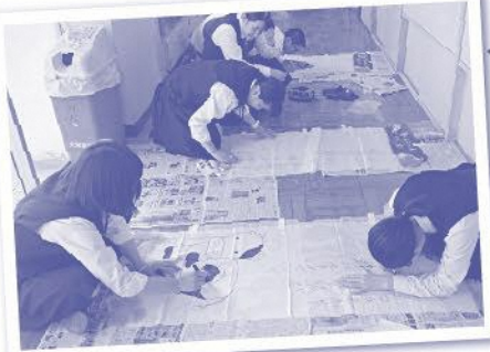
直筆メッセージ記載中