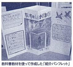
教科書教材を使って作成した「紹介パンフレット」

作成に当たって、子ども たちは、教科書教材「ち いちゃんのかげおくり」 で学んだ物語の読み方を 基に、紹介する作品につ いて捉えた「登場人物の 人柄」や、想像した「場 面の移り変わりに即した 気持ちの変化」等が表れ るよう、伝える内容を選 んで書いていました。 「作品の魅力を紹介する」 という言語活動を通して、 物語を読む力を育てる実 践でした。