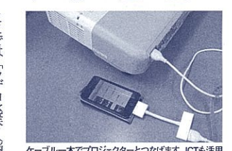
ケーブル一本でプロジェクターとつなげます。ICTも活用

「提供は良くない」と言う生徒には、「でも、自分の家族が臓器提供を必要とする状態であればどうか？」と状況を想像できるようにするので、コミュニケーション能力を高める効果もあると思います。