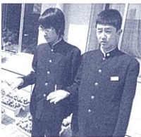
検証実験-自ら感じる