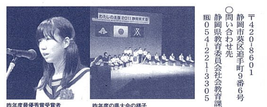
昨年度最優秀賞受賞者 昨年度の県大会の様子

作品募集 ○内容 社会や世界に向けての意見 未来への希望や提案など、心 からの思いや考えを、中学生 ならではの視点で発表しな さい。 ○応募方法 各学校ごとに2点を提出し、 応募票を添付し、郵送す る。 ○提出 国・県・市町立中学校 (各市町教育委員会 (私立中学校) 県教育委員会社会教育課 (私立中学校)