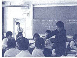
太陽と地球の位置は…

中学3年生の授業では、生徒から「ここは入試に出ますか」という質問をよく受けます。