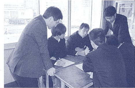
正しく恐れるために、放射線を学ぶ

「夏は地球と太陽が近くなるから」と考える生徒が多くなります。暖房器具に近い方が暖かいという経験があるからです。