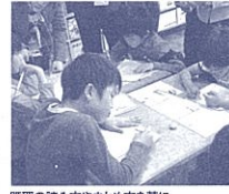
既習の読み方やまとめる方を基に、作品の魅力を「紹介パンフレット」にまとめている

「紹介パンフレット」の 小学校3年生の国語の 授業です。子どもたちは 朝読書等で読んできた戦 争を扱った物語の中から その魅力を「紹介パンフ レット」にまとめていき ます。