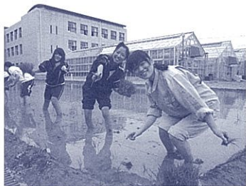
生徒と一緒に田植え(筆者右端)