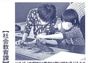
ドクサメの解剖に真剣に取り組む子どもたち