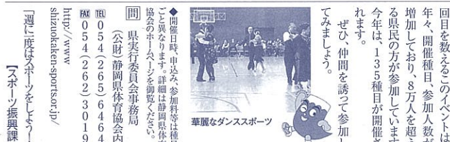
華やかなダンススポーツ

暖かな学級づくり にオススメ 授業や研修で活用できるよう100本以上のビデオやDVDをそろえて貸出しをしています。 人権一般からいじめ問題、同和問題、セクハラ、パワハラ問題、障がいのある人・女性・高齢者や外国人の人権問題、北朝鮮による拉致被害者の人権問題まで、幅広い内容を用意しています。 貸出し作品のあらすじや内容は、教育政策課ホームページに掲載されていますので、御覧ください。 ◆開催日時 申込み、参加料等は種目ごと異なります。詳細は静岡県体育協会のホームページを御覧ください。 県実行委員会事務局 (公財)静岡県体育協会内 〒420-8601 静岡市葵区追手町9番6号 TEL.054(262)6464 FAX.054(262)30119 http://www.shizuoka-sports.jp/