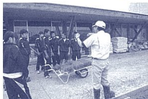
ドキドキ!田植え体験