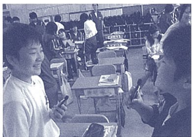
楽しく会話を続けよう