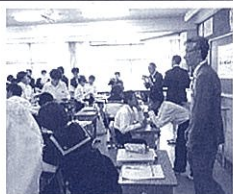
会話を続ける練習タイム