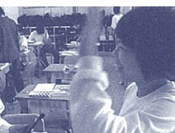
"Oh, really? Me, too!"でハイタッチ

ゲームや芸能人の話で盛り上げられます。ビデオの前では緊張? 毎回2ペアずつ、会話をビデオで撮影しています。全員の撮影が終わった、コンビニエンスストアで自分の会話を見て、「ここでこんなことを言いたかったけど、何て言えよよかったのかな」とのとき黙ってしまっただけ、こんな質問をすれば話が盛り上がったかも」というような振り返りをしています。