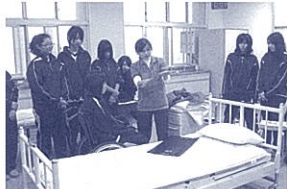
介護について学ぶ

総合学科高校の一番の特徴は、自分の興味のある分野を自ら選び、学べる点です。本校の全日制