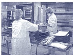
パン作りにも挑戦する生徒

と理解しようと思ひ、田植えの授業に参加してみました。毎春秋に収穫する黒米の苗を植える授業。様々な系列の生徒が参加しています。田んぼの中