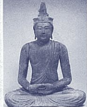
大日如来坐像 (展示期間: 10月12日まで)