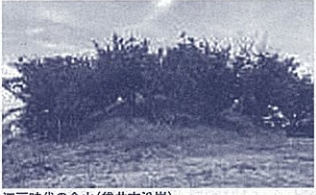
江戸時代の命山(袋井市沿岸)