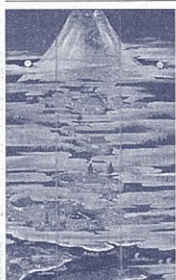
富士山参詣茶室図 (展示期間: 10月4日まで)

富士山は神の棲みか。山梨県山梨市と山梨県富士宮市にまたがる。平安時代には、修行の山、民俗資料等140点の作品を一堂に会した「富士山」展を開催。10月12日(月)から10月13日(火)まで開催期間。開館時間 午前10時、午後5時30分(入室5時まで)。観覧料 一般1000円、大学生以下 無料。70歳以上500円(400円)。※内は20名以上の団体料金。*富士山参詣茶室図は、10月4日まで展示。このほかにも作品の展示替えあり。*富士山 展の詳細は静岡県立美術館Pを参照願います。