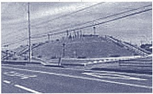
現代の命山(袋井市沿岸)