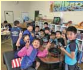
コミュニティスペースりぼん (富士市)

商店街の空き店舗を利用し、子供たちや地域の人たちの居場所となるコミュニティースペースとして活動している。両親が共働きの子供が立ち寄れる場所、保護者の相談機関、子供の作品を展示するギャラリー、商店街イベントへの参加等、子供の居場所づくりだけではなく、地域や商店街の繋がり形成にも寄与している。