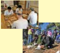
静岡市立清水桜が丘高等学校 囲碁将棋部 (静岡市)

平成25年4月から、地域と交流しながら棋力を向上させるために始めた地域の施設でのボランティア活動をきっかけに、活動を拡大しながら継続している。高齢者福祉施設だけではなく、夏休みには小学校へ出向き、宿題の手伝いも行う。三保の松原の清掃活動にも参加するなど、地域の活動に大きく貢献している。