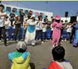
静岡県立静岡西高等学校 音楽部 (静岡市)

静岡浅間神社廿日会祭例大祭に8年間継続参加し、平成25年からは、演奏活動及び音響担当等を含めたステージ運営全般を担っている。特別養護老人ホーム「小坂の郷」秋祭りでは入所者との触れ合いの時間を大切に演奏活動を実施。地域に根ざした活動を通して、地域のコミュニティづくりに貢献している。