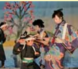
浦川歌舞伎保存会 (浜松市)

一度廃れてしまった地域の伝統芸能を再興させ、地域文化の向上に力を注いだ。浦川小学校の児童のほとんどが秋の公演に参加しており、演目「白浪5人衆」は6年生の児童が担当している。歌舞伎の指導や公演をとおり地域に根付いた活動を展開し、子供たちと地域を繋ぐ役割も果たしている。