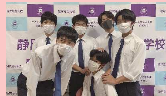
有志団体US (静岡県立駿河総合高等学校) (静岡市駿河区)

駿河総合高等学校の生徒6人のメンバーで、「地域貢献」をキーワードに災害支援活動等に取り組んでいる。授業で学んだSDGsの知識を生かし、企業と協力し独自性のある活動を継続。幅広い年齢層に対応した活動は、地域の人々から大変喜ばれている。