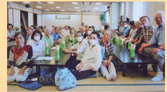
シニアクラブ江尻 (静岡市清水区)

学校教育に長年携わり、子どもたちの教育活動の推進を支えている。また、コミュニティ・スクールでは学校と地域をつなげる橋渡し役を担っている。児童の地域学習の際には、地域の知識を伝え、安全を見守るなど学校に無くてはならない存在である。