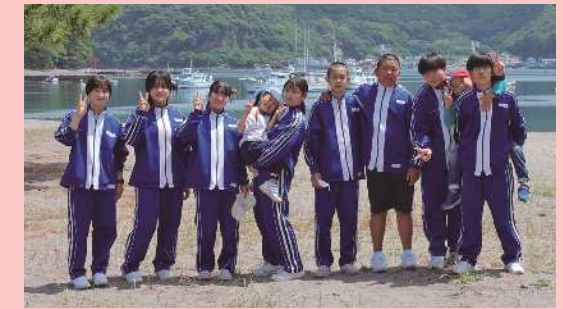
沼津市立戸田小中一貫学校 自治会 (沼津市)

学校自治会が主体となり、御浜岬の海岸美化活動を継続。地域の環境美化委員やこども園などと一緒に活動し、学校と地域の連携強化にもつながっている。観光スポットの清掃活動を行うことで子どもたちの郷土愛を育てる活動となっている。