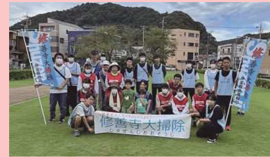
静岡県立伊豆総合高等学校 生徒会 (伊豆市)

生徒会が主体となり、10年以上にわたり毎月の地域の清掃活動を継続。地域の高齢者から子どもまで幅広い年齢層の人々が清掃活動に参加し、地域住民が交流する機会となっている。清掃活動を通し、明るく住みやすい地域作りに貢献している。