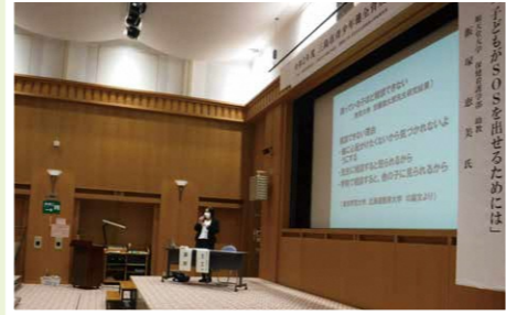
三島市「子供がSOSを出せるためには」