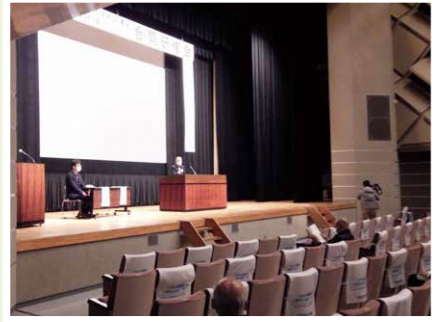
下田市 「思うことあれこれ ～人づくりと青少年健全育成～」