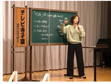
裾野市 テレビ寺子屋公開収録講演会 「やる気ってなんですか？」 「ストレスから学ぼう、 コロナ禍での心の整え方」