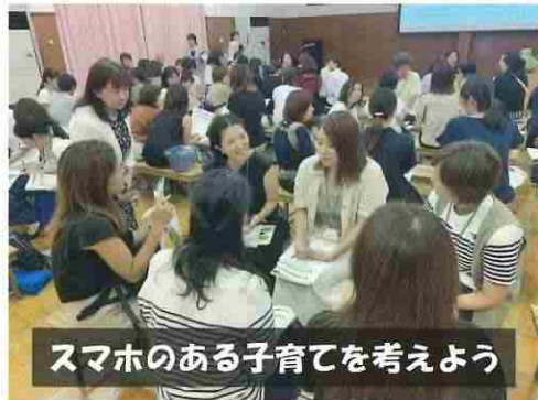
スマホのある子育てを考えよう

NPO法人イーランチは「家庭も子育てでも大切にしながら社会参加もしたい」という女性たちが2003年に設立し、青少年のインターネット安全利用の啓発に力を入れてきました。その後インターネットは飛躍的な進化を遂げ、情報機器も多様化し、その便利さや楽しさを享受する一方、「ネットいじめ」「ネット依存」「不適切な投稿」等、青少年の事件やトラブルは年々複雑化し、安全利用のための研修やネットパトロールがより求められている状況です。