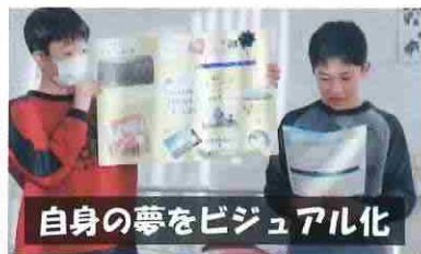
自身の夢をビジュアル化