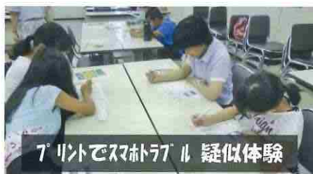
プリントでスマホトラブル疑似体験

ールの作り方や守り方、あるいは子供の手本となる使い方を示すなど、保護者の心構えを伝えるセミナーを全国の幼稚園・保育園等で120回実施、延べ7500人以上の乳幼児の保護者にご参加いただきました。 さらにインターネットの災害時の有効利用や、キャッシュレス決済で利用者が増加した高齢者のスマホ利用のサポート、そして年々増加し巧妙化するサイバー犯罪に対するセキュリティ対策を伝えることも、これからの重要なミッションと考えます。私たちはこれからも、誰もがICTで豊かに暮らせる社会づくりを応援します。