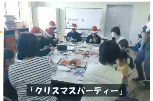
「クリスマスパーティー」

浜松市消防局の協力によりAEDや心肺蘇生法の体験、消防車の見学や消防服の試着等を実施