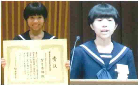
全国4,180校、48万人を超える中学生の中から選ばれた12人が全国大会で発表