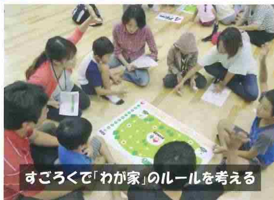
すぐろくで「わが家」のルールを考える

今年度は、中高校生向けの教材印刷に「県民運動推進事業費補助金」を使わせていただき、従来の一方的に話を聞くだけの講演スタイルではなく、手を動かし、事例を学べる講座を実施しました。