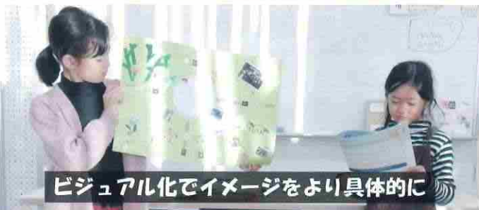
ビジュアル化でイメージをより具体的に