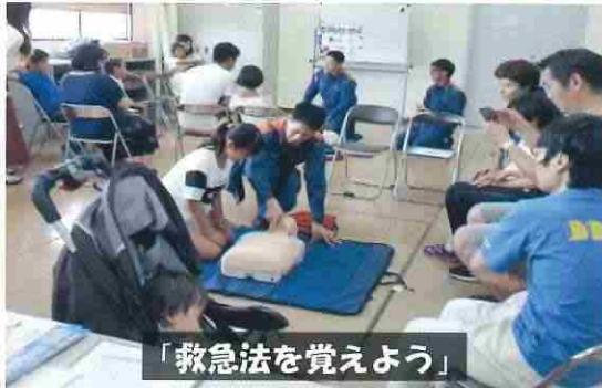
「救急法を覚えよう」

主催者のレク楽の会は、子供からシルバースター世代までみんなで気軽に楽しめるレクリエーション財の紹介、レクリエーションをとおしての異世代交流・地域交流・男女共同参画の推進に取り組むほか、県教育委員会が定める青少年指導者の養成、日本レクリエーション協会レクリエーションインストラクターの単位認定が可能な事業を生かしてのレクリエーション指導者の育成と発掘をめざして活動しています。