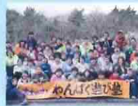
富士のさと わんぱく遊び塾 (裾野市)

地域の小学生のために、「遊び」を通して「人との関わりの楽しさ」や「社会性」を育むことを目的とした体験活動を、14年にわたり提供している。団体の活動は、すべて地域の青年が主体となり、自主的に運営・実施している。