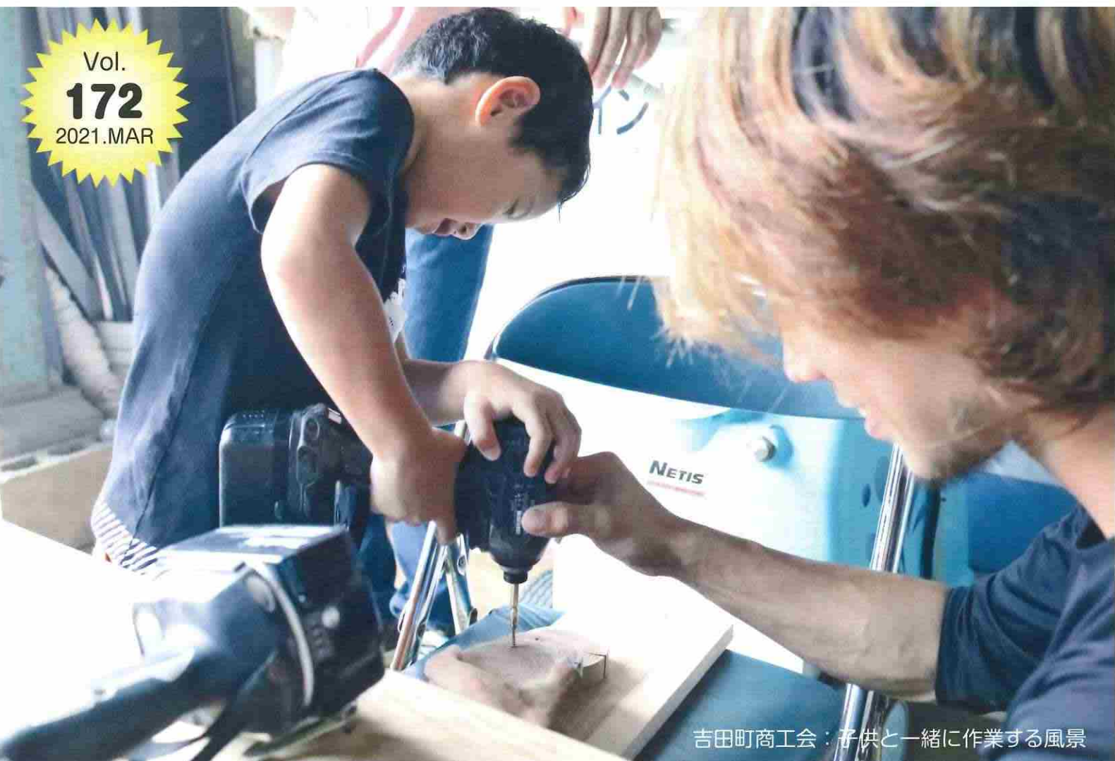
吉田町商工会：子供と一緒に作業する風景