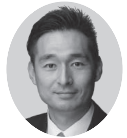
自民党 昭和三十五年六月二十一日生 42歳