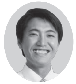
立憲民主党公認 昭和五十八年八月九日生(三十五歳)

清水から優しい新風を。 35才の挑戦! 20歳の時、夢を追いかけて東京の大学に進学しました。卒業後、衆議院議員秘書を経験し、政策提案、陳情、後援活動を通して政治の必要性を肌で感じました。その後、保育園と障害者福祉、食品メーカーの現場で働き、福祉の現場、製造業の現場の労働環境を改善の必要性を痛感いたしました。僕らの世代はゆとり世代と言われたり、就職氷河期だったり、非正規雇用社員が増えたり、将来の年金に不安を感じたり… 両親がしてくれたことを、子供や孫たちにしてあげることが出来るのだろうか、いつも不安に感じています。立憲民主党と活動を共にしたのは、「国民が政治から離れたのではなく、政治家が国民から離れた」という理念に共感したとの対話」という理念に共感した からです。僕には大きな組織が付いてくれているわけはありません。でも、だからこそ僕はいつも皆さんと近いところにいます。僕は約束します。みなさんと同じ目で清水の政治の問題点を見つけ出し、それを正していきます。みなさんと同じ耳で一人一人のお話をしっかりと聞き、対話をしていきます。みなさんと同じ足で地元をくまなく歩き、みなさんと共に歩んでいきます。みなさんと同じ手で僕も一所懸命に働き、この静岡と清水とここに暮らすすべての人たちの未来をみなさんと一緒に創っていきます。僕の全てはみなさんと同じです。