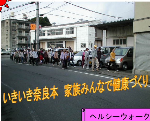
ヘルシーウォーク