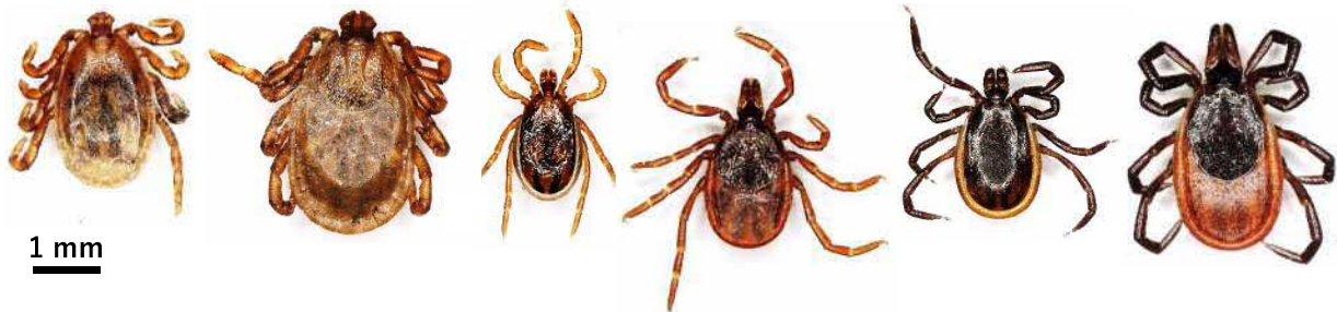
図 1. 北海道内でよく見られるマダニ (左から順に、オオトゲチマダニのオス、メス、ヤマトマダニのオス、メス、シュルツェマダニのオス、メス。特にヤマトマダニ、シュルツェマダニが人を刺すと言われている)