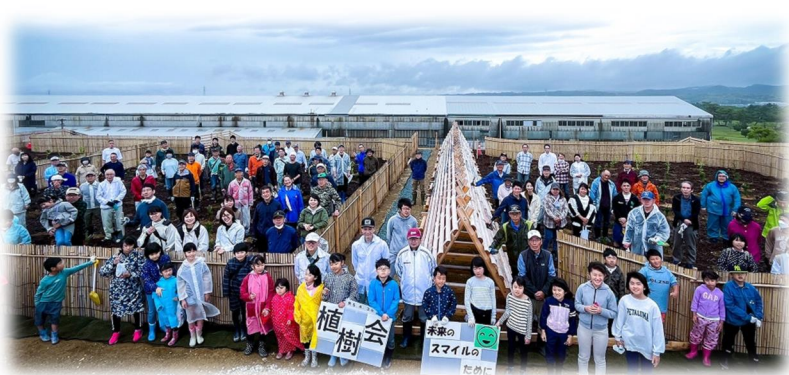
けんみんさんか かいがんりんさいせいび ふくろいししよくじゆさい 県民参加による海岸林再整備(袋井市植樹祭)