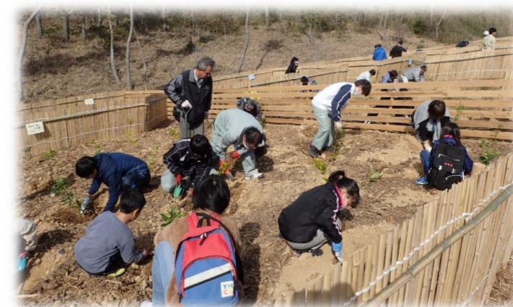
けんみんさんか かいがんりんさいせいび 県民参加による海岸林再整備(磐田市植樹祭) いわたししょくじゆさい

～暮らし まも を守る海岸 かいがん 防災 ぼうさいりん 林 さいせいび の再整備～