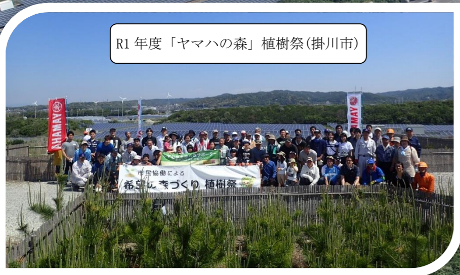
R1年度「ヤマハの森」植樹祭(掛川市)