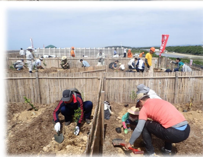
けんみん さんか かいがかりん さいせいび かけがわし しよくじゆさい 県民参加による海岸林再整備(掛川市植樹祭)