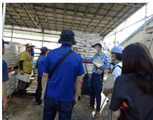
作業管理方法の説明

10月5日（水）に、令和4年度新規就農者経営発展セミナー第4回を開催し野菜、果樹等様々な作目の新規就農者および研修生計8名が参加しました。