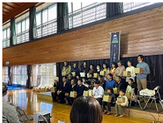
（サポーターへの返礼品授与式）

令和5年度にふじのくに美しく品格のある邑づくり知事顕彰を受賞した「久留女木の棚田～竜宮小僧伝説の邑～」(浜松市北区引佐町)において、12月10日に収穫祭が開催されました。