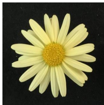
スイングレモネード