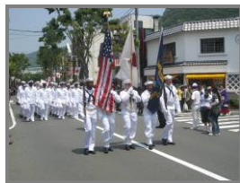
記念公式パレード