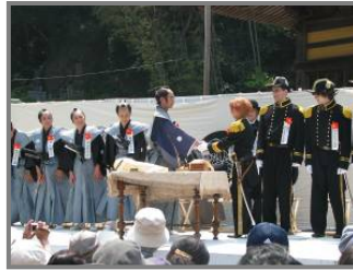
日米下田条約調印の再現劇