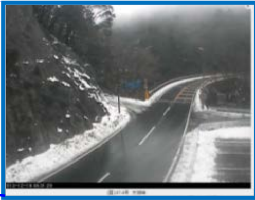
↑↑カメラから見える様子