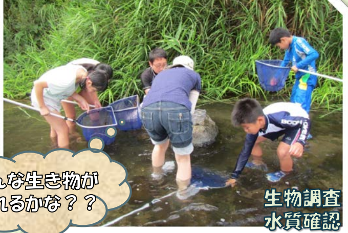
生物調査 水質確認