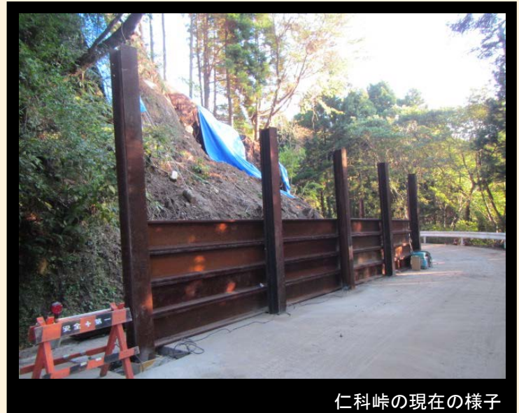
仁科峠の現在の様子