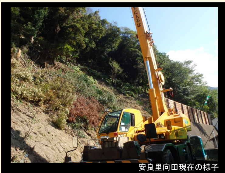
安良里向田現在の様子