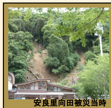
安良里向田被災当時