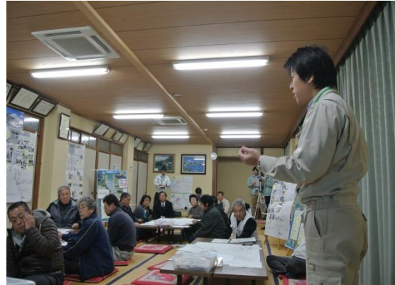
第2回地区協議会風景