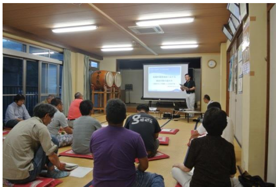
第5回地区協議会風景