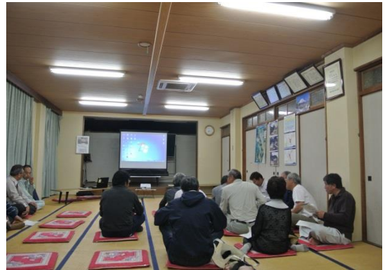
第4回地区協議会風景