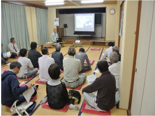
第1回地区協議会風景