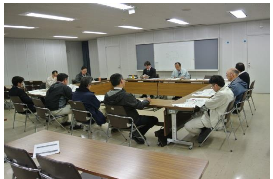
第6回地区協議会風景