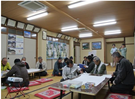
第3回地区協議会風景