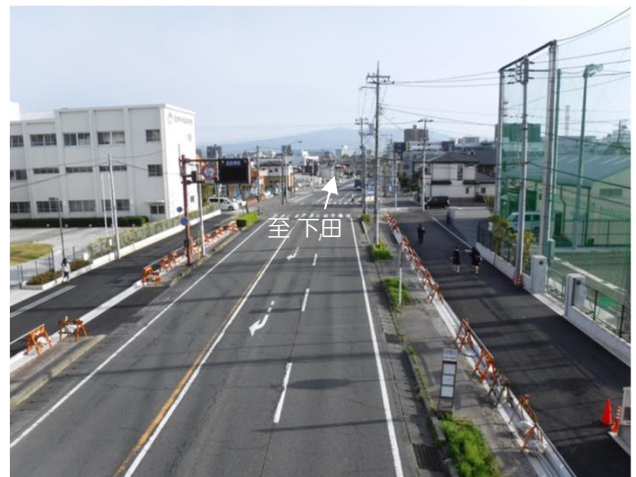
現況写真（南側工区）