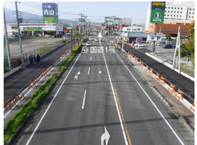
現況写真（北側工区）