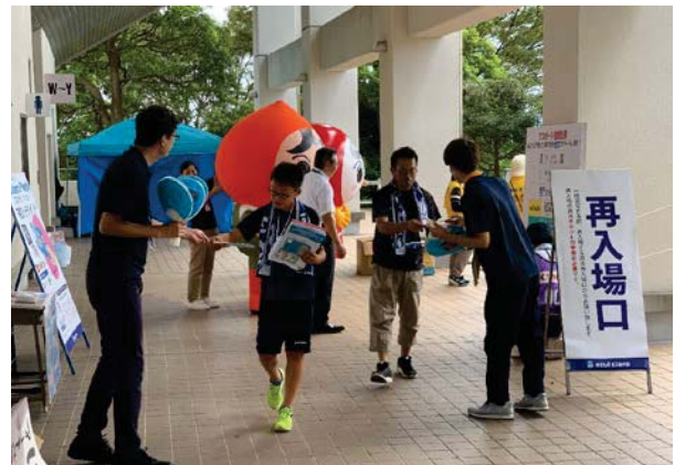
入場ゲートでうちわを配布！（約800枚配布）