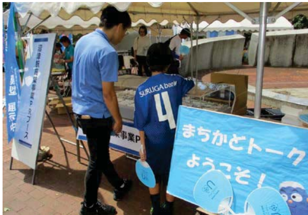
PRブースで模型を展示！