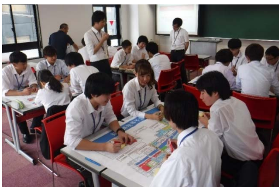
必要な都市機能について意見を出し合う

9月28日(木)に大原公務員医療観光専門学校を訪問し、公務員課の1年生を対象に鉄道高架後のまちづくりについて、グループワークを開催しました。