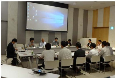
様々な視点から中心市街地について意見交換

市街化区域内における居住と都市機能を誘導する区域を示す「立地適正化計画」と沼津駅周辺総合整備事業など各種事業と既存ストックの活用・連携を図る「中心市街地まちづくり戦略」について議論を進めていきます。