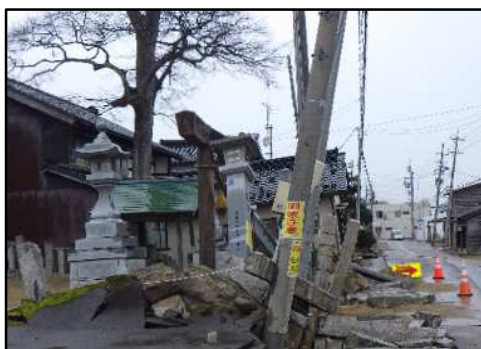
石川県かほく市内