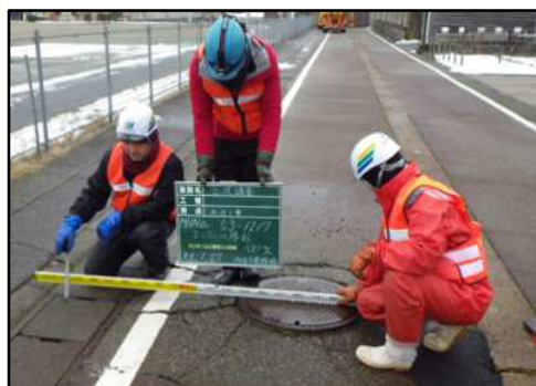
下水道管路の調査