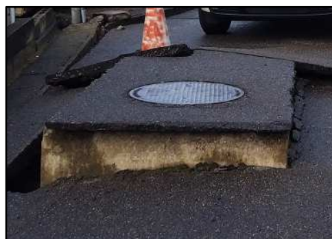
隆起したマンホール