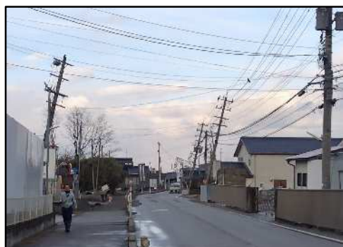
石川県河北郡内灘町内

マンホールが隆起している箇所や滞水している箇所などがみられ、調査を実施しています。