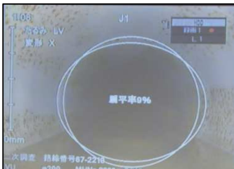
下水道管路のカメラ調査

○問合せ先 沼津土木事務所下水道課 下水道班 ☎055(920)2223 狩野川西部浄化センター班 ☎055(968)2623 狩野川東部浄化センター班 ☎055(978)7517