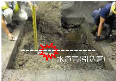
水道管の破損状況

土質調査業務委託において、掘削作業を行った際に、埋設されていた水道管(引込管)を破損した。