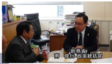
総務省南政策統括官と 懇談する渋谷村長