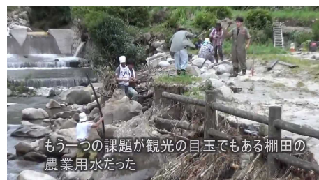
もう一つの課題が観光の目玉でもある棚田の 農業用水だった