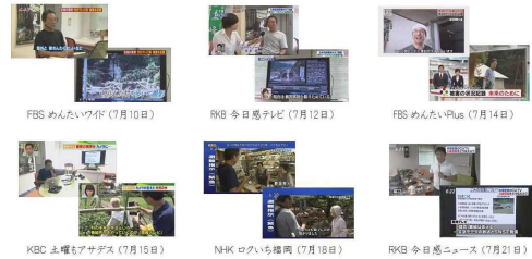
平成29年7月九州北部豪雨 メディア掲載