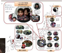
一緒に制作中の全国のお仲間 40地域以上のネットワーク