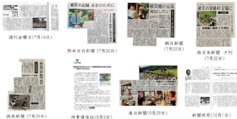
平成29年7月九州北部豪雨 メディア掲載