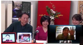
1月5日(日)から毎週日曜日生放送実施!