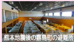
熊本地震後の嘉島町の避難所