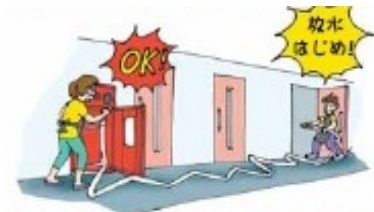
イラスト：「個室型店舗の消防訓練マニュアル」 (総務省消防庁)より引用