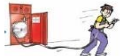
イラスト：「個室型店舗の消防訓練マニュアル」 (総務省消防庁)より引用