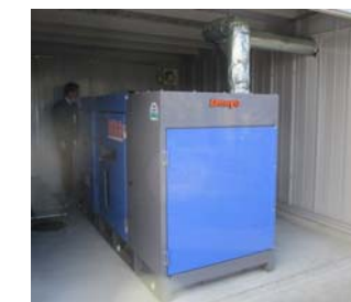
(非常用の発電装置)