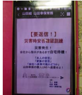
(ラインによる安否確認訓練)

災害等発生時の社員とその家族の安否確認は、グループラインを活用して行うこととしており、安否確認訓練を年2回実施。社員が必要とする場合は、スマートフォンを貸与している。今後は、協力会社も含めて、ラインによる安否確認体制を整備したいと考えている。