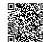
災害対応・BCP事例紹介

http://www.pref.shizuoka.lg.jp/soumu/so-450a/bcp.html