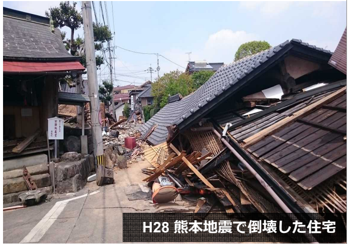
H28 熊本地震で倒壊した住宅