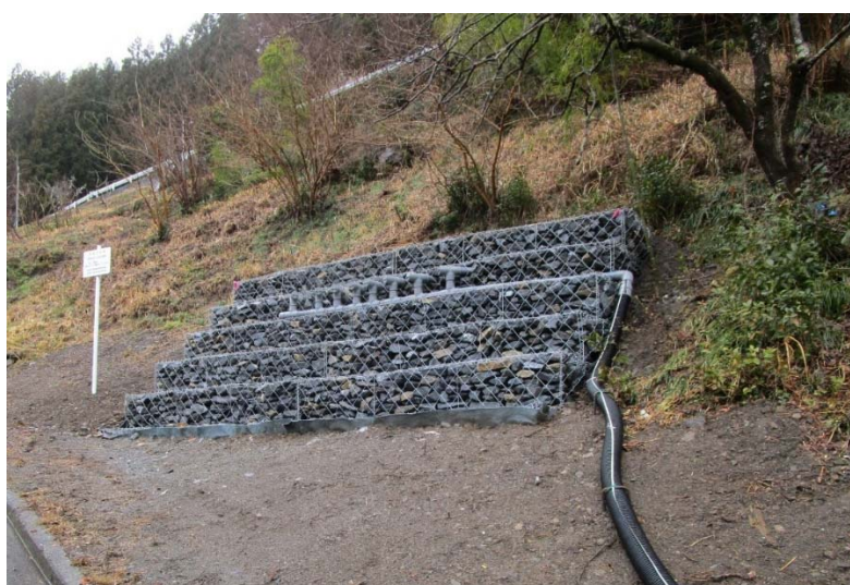
図 1 No.1 箇所

来年度からは地すべり防止事業にて対策工事及び地すべり調査を実施し、引き続き地すべりブロックの安定を図っていきます。