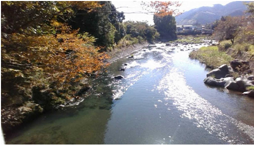
◎児童が撮ったベストショット