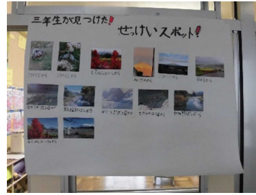
◎3年生が見つけた！絶景スポット！