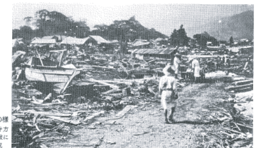
図14-8 現静海町の様子 仏光寺方向を見た津波による被害状況