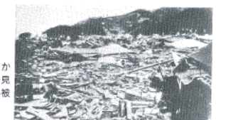
図14-16 現和田1丁目から新井方向を見た津波による被災状況