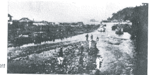
図14-13 伊東大川河口付近の様子