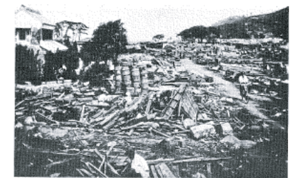
図14-7 秋葉美の津波被災状況