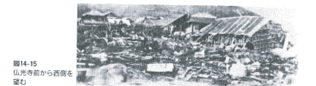
図14-15 仏光寺前から西側を望む