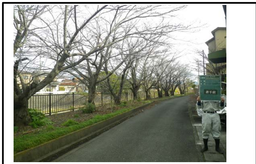
着 手 前