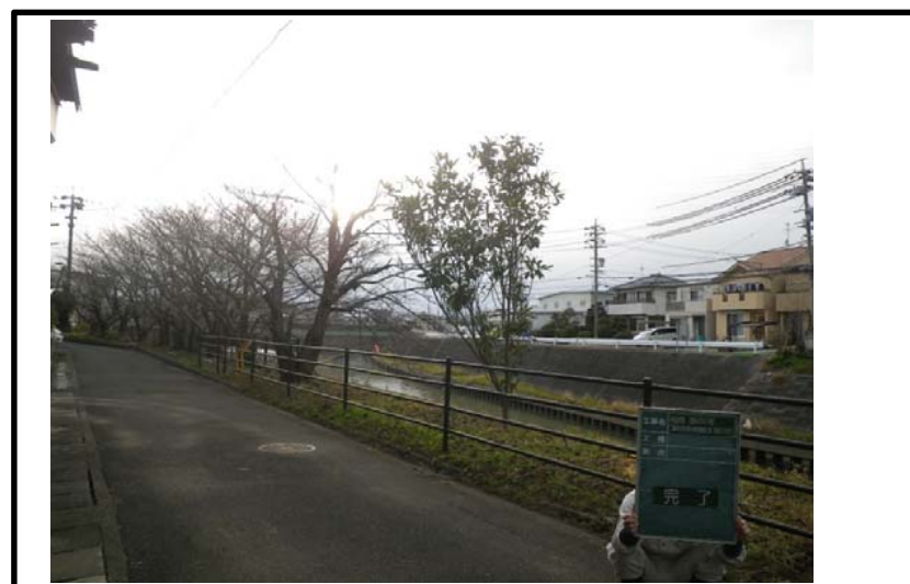
着 手 前