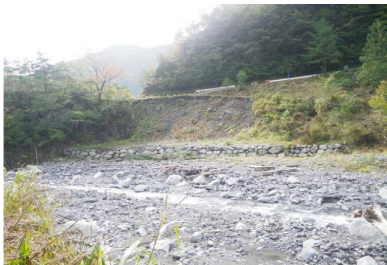
着 手 前