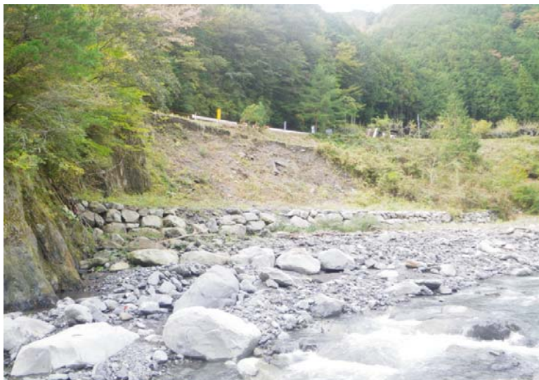
着 手 前