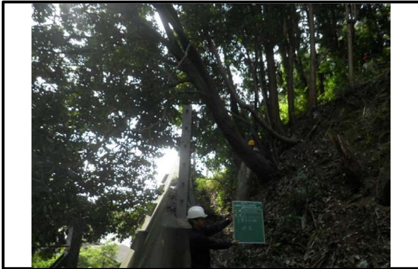
着 手 前