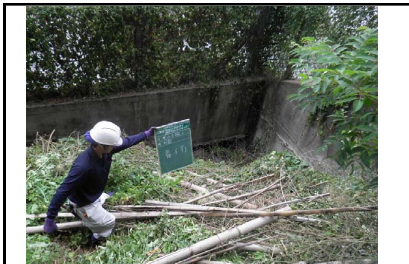
着 手 前