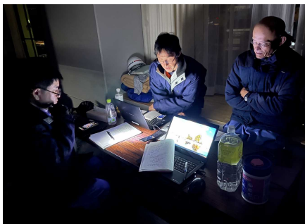
停電の中でのミーティング