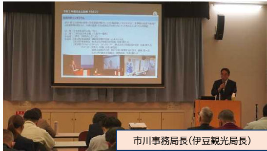
市川事務局長(伊豆観光局長)