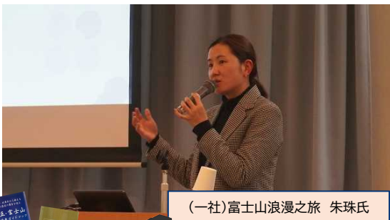
(一社)富士山浪漫之旅 朱珠氏