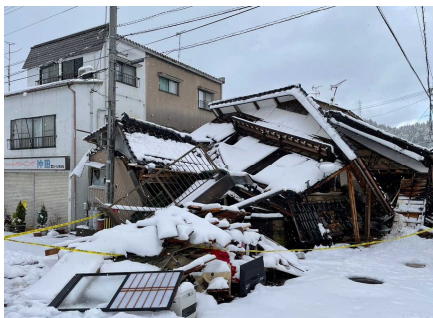
市街地建物被害状況