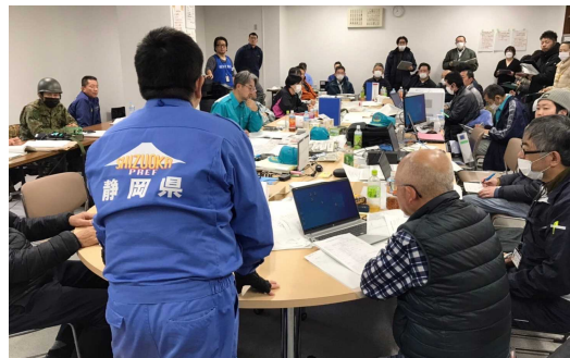
第1陣(1月3日から) 町対策本部会議の様子

災害マネジメント支援チームの主な活動内容は、穴水町職員への災害対応に関する助言、支援ニーズの調査、家屋被害認定調査や避難所運営の支援体制の調整です。