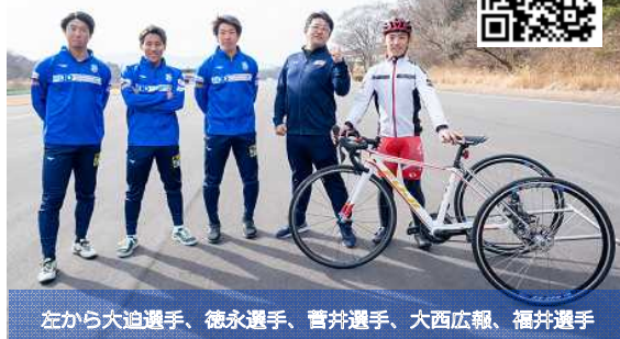
左から大迫選手、徳永選手、菅井選手、大西広報、福井選手