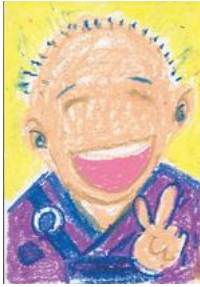
富士宮市 地域防災指導員