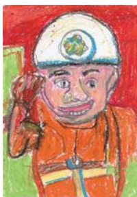
元菊川市消防団員