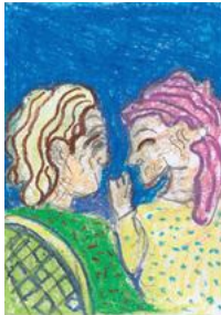
菊川市 民生委員児童委員