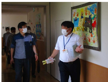
児童の作品を紹介