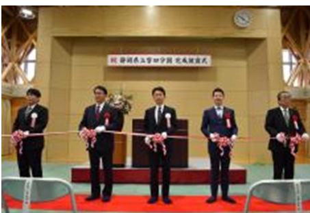
完成披露式テープカット