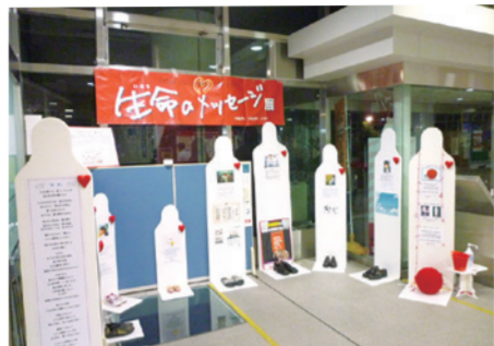
▲10月中旬まで静岡市駿河区で行われていた展示